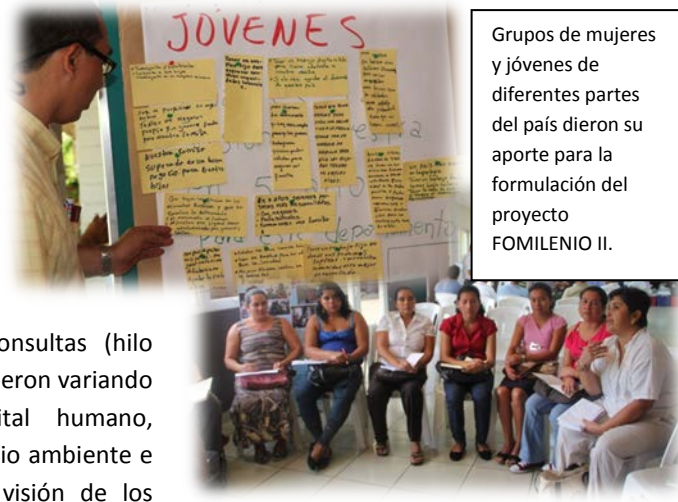
Grupos de mujeres y jóvenes de diferentes partes del país dieron su aporte para la formulación del proyecto FOMILENIO II.

3.-¿Qué se debe hacer para que usted y su grupo puedan aprovechar las capacitaciones y las mejoras en educación que se realizarán dentro de FOMILENIO II?