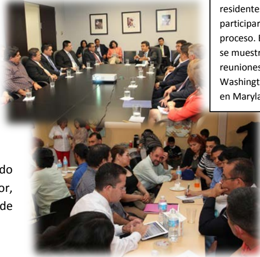
Los salvadoreños residentes en EUA participaron en el proceso. En las fotos se muestran reuniones en Washington D.C. y en Maryland.