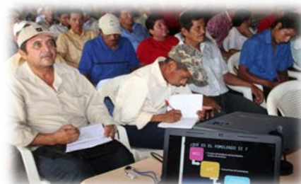
Agricultores, miembros de cooperativas y del sector de pesca participaron activamente en las consultas.

También se consideraron representantes de agencias donantes, bilaterales y multilaterales, personal diplomático acreditado y cooperantes voluntarios. Abarcó los institutos políticos nacionales, sindicatos, religiosos, mujeres, emigrados, académicos, comunidades y empresas cooperativas.