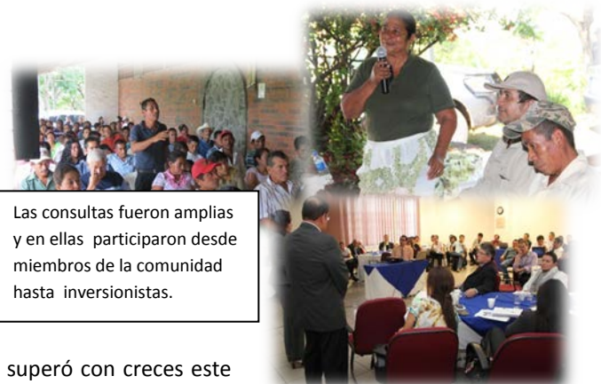
Las consultas fueron amplias y en ellas participaron desde miembros de la comunidad hasta inversionistas.

A las consultas asistieron representantes de más de 100 de los 262 municipios de El Salvador, principalmente de la zona costera. Estas se realizaron entre enero y julio de 2012, periodo en el que se llevaron a cabo alrededor de 86 actividades, dentro y fuera de El Salvador, y a las que asistieron más de 3,000 personas, entre ellos salvadoreños residentes en Estados Unidos. El 58.6% de los consultados fueron hombres y el 41.44 % mujeres. Cabe resaltar que en el proceso consultivo para el Primer Compacto se abarcó alrededor de 1,500 personas, con lo que las consultas para un FOMILENIO II superó con creces este número además de haber sido más participativo.