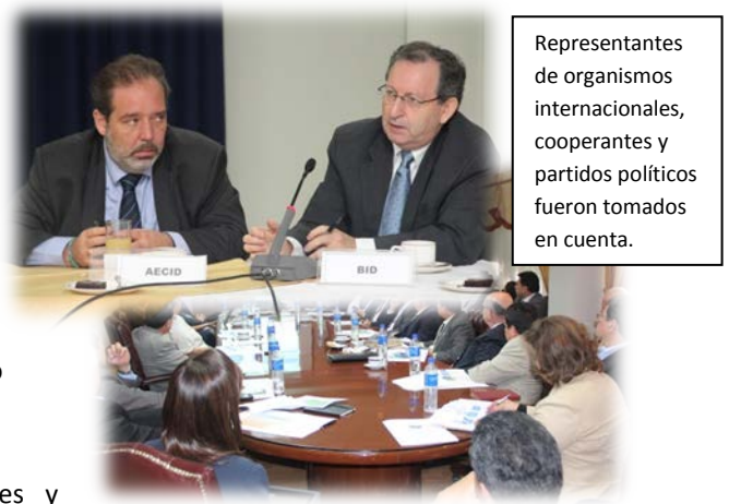
Representantes de organismos internacionales, cooperantes y partidos políticos fueron tomados en cuenta.

Del sector productivo, se incluyó: Agricultura, ganadería, pesca, acuicultura, agroindustria, hotelería, turismo y servicios complementarios.