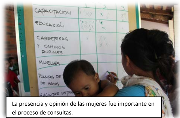
La presencia y opinión de las mujeres fue importante en el proceso de consultas.

En la fase de elaboración inicial de la propuesta, la consulta se enfocó hacia el conocimiento y análisis de las notas conceptuales con diferentes grupos de los ámbitos institucional y regional referidos. La consulta tenía el objetivo de dar información sobre el FOMILENIO II (vinculación con el APC, su alcance y sus áreas principales) y obtener comentarios de la población sobre esta propuesta para enriquecerla.