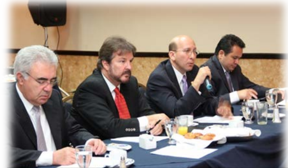
El sector privado de de El Salvador fue consultado. En la fotografía se muestra la participación de los líderes gremiales de CAMAGRO, Cámara de Comercio, ASI Y ANEP.